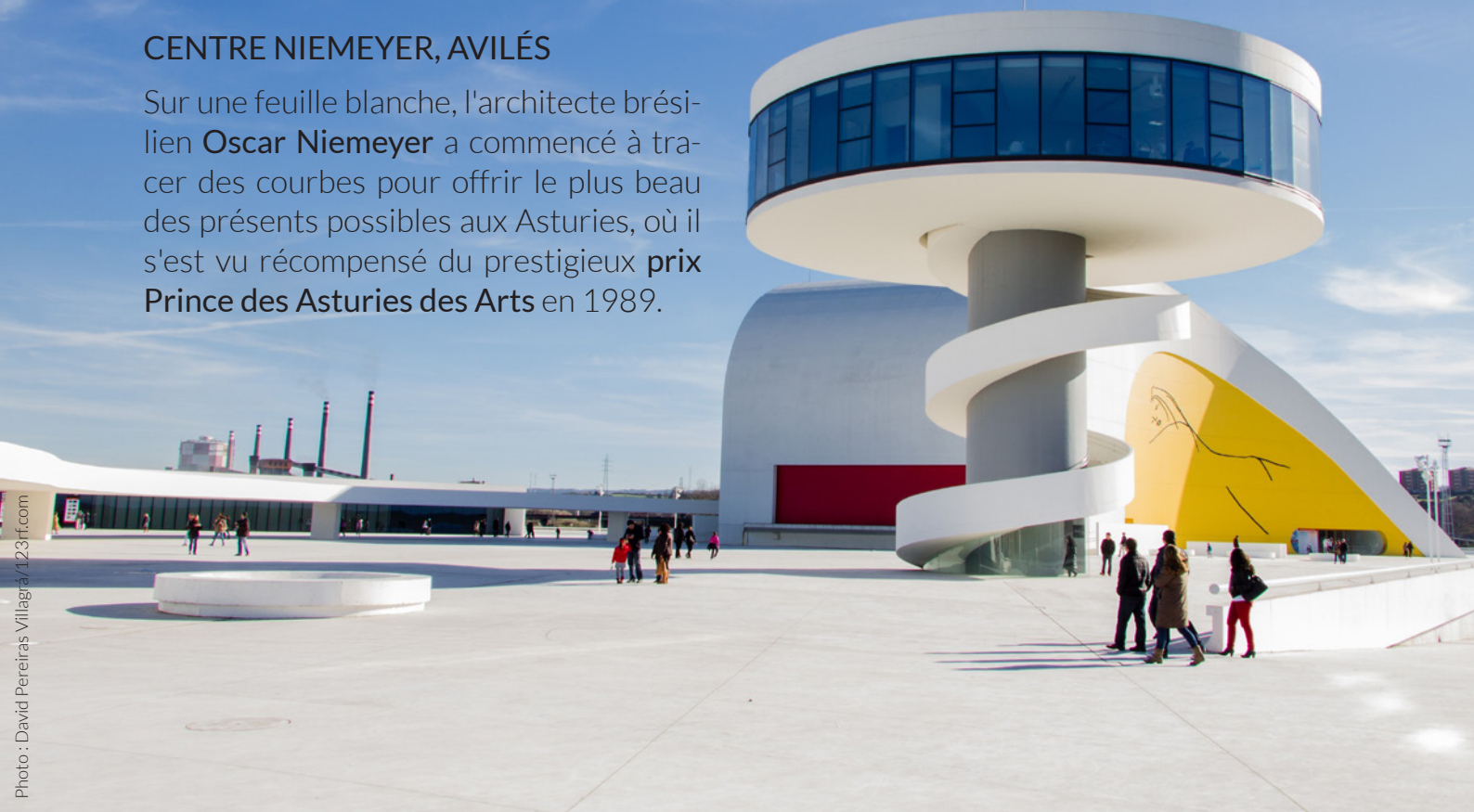
▲ CENTRE NIEMEYER AVILÉS