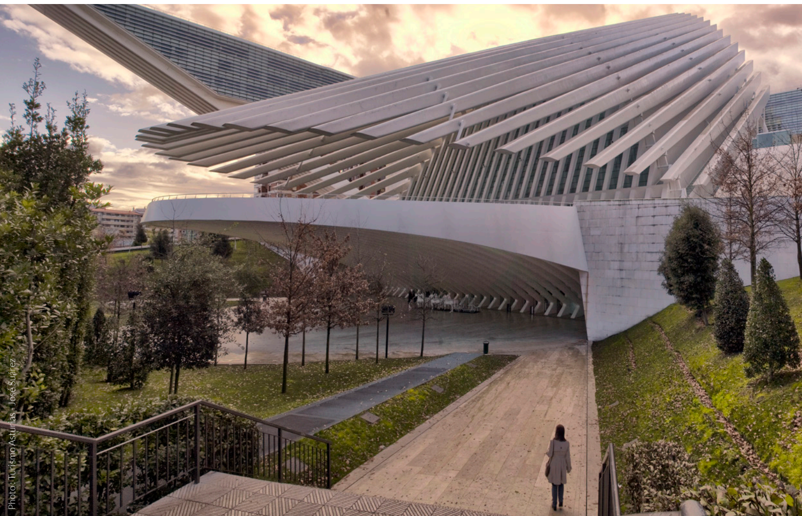
▲ PALAIS DES CONGRÈS OVIEDO