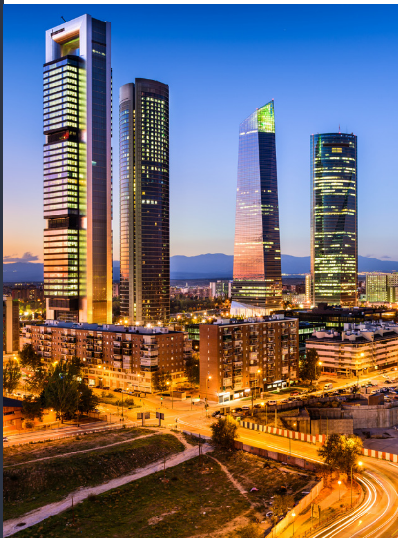
▲ COMPLEXE DES CUATRO TORRES MADRID

La Torre de Cristal , l'édifice le plus haut d'Espagne, ne manquera pas de vous donner le vertige avec ses 249 mètres d'altitude . Elle a été construite par César Pelli , l'architecte des célèbres tours Petronas de Kuala Lumpur, en collaboration avec le cabinet madrilène Ortiz León Arquitectos . Sa façade en forme de crystal taillé et le jardin vertical de sa coupole l'imposent parmi les bâtiments les plus impressionnants de l'architecture de la ville.