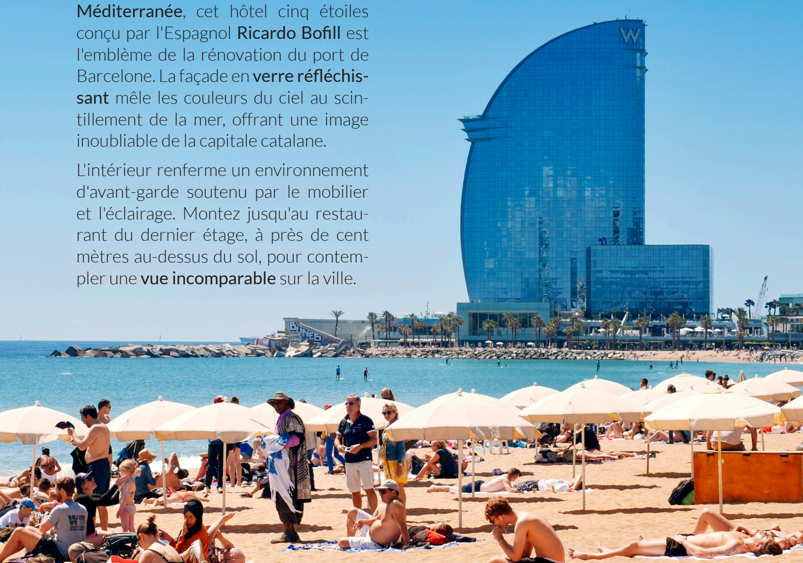
▲ W HOTEL BARCELONE

L'intérieur renferme un environnement d'avant-garde soutenu par le mobilier et l'éclairage. Montez jusqu'au restaurant du dernier étage, à près de cent mètres au-dessus du sol, pour contempler une vue incomparable sur la ville.