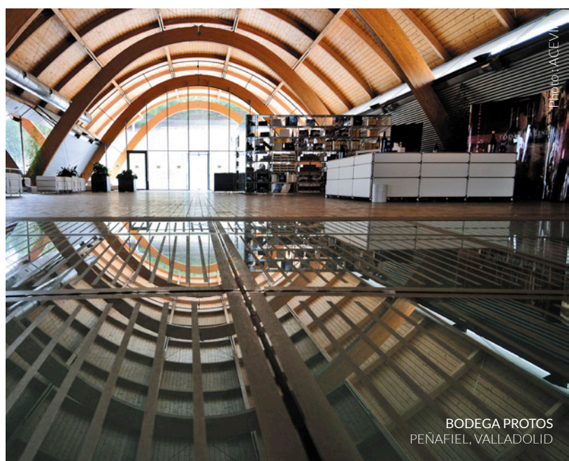
BODEGA PROTOS PEÑAFIEL, VALLADOLID

La toiture de la cave forme un élément visuel très fort. Le meilleur endroit pour l'apprécier se situe précisément sur les hauteurs du château : les cinq travées recouvertes de pièces en céramique de grand format rappellent la couleur et la forme des tuiles typiques de la région.