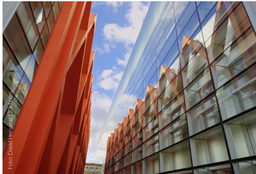
▼ MUSEO DE LA EVOLUCIÓN HUMANA BURGOS

El edificio emerge a superficie con dos volúmenes , uno largo y opaco, otro quebrado, anguloso y más transparente. Juntos conforman una suerte de plaza sobre el puerto de Cartagena, un hermoso espacio público para exposiciones y actividades al aire libre. Culmina tu visita en uno de los lugares más destaca-