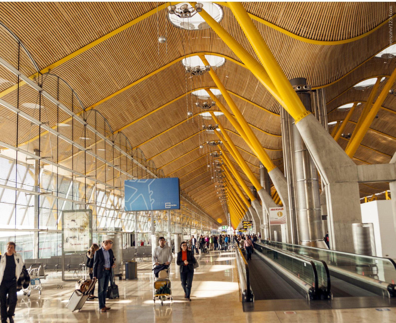
▼ TERMINAL 4 DEL AEROPUERTO DE MADRID-BARAJAS ADOLFO SUÁREZ MADRID

“Una celebración del viaje que captura la vida del ciudadano”, según Rogers, que puso en práctica su experiencia con la arquitectura bioclimática para su diseño vanguardista. Para potenciar la orientación del viajero, los pilares de la zona de embarque van cambiando de color, aportando una riqueza cromática que te sorprenderá.