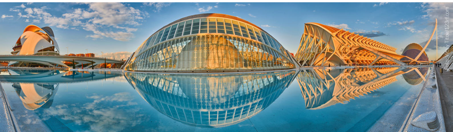
▲ CIUDAD DE LAS ARTES Y LAS CIENCIAS VALENCIA