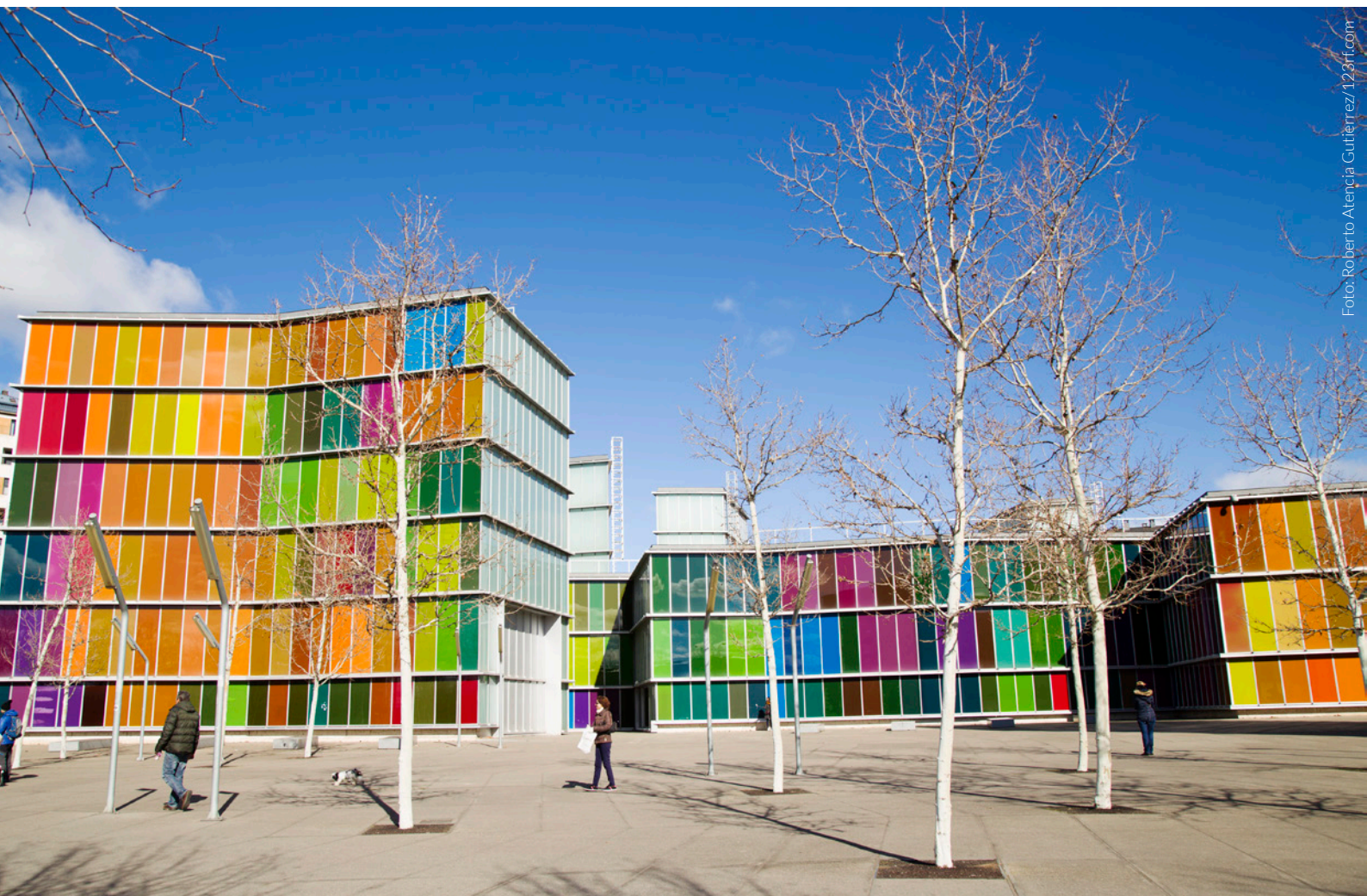
▲ MUSAC LEÓN