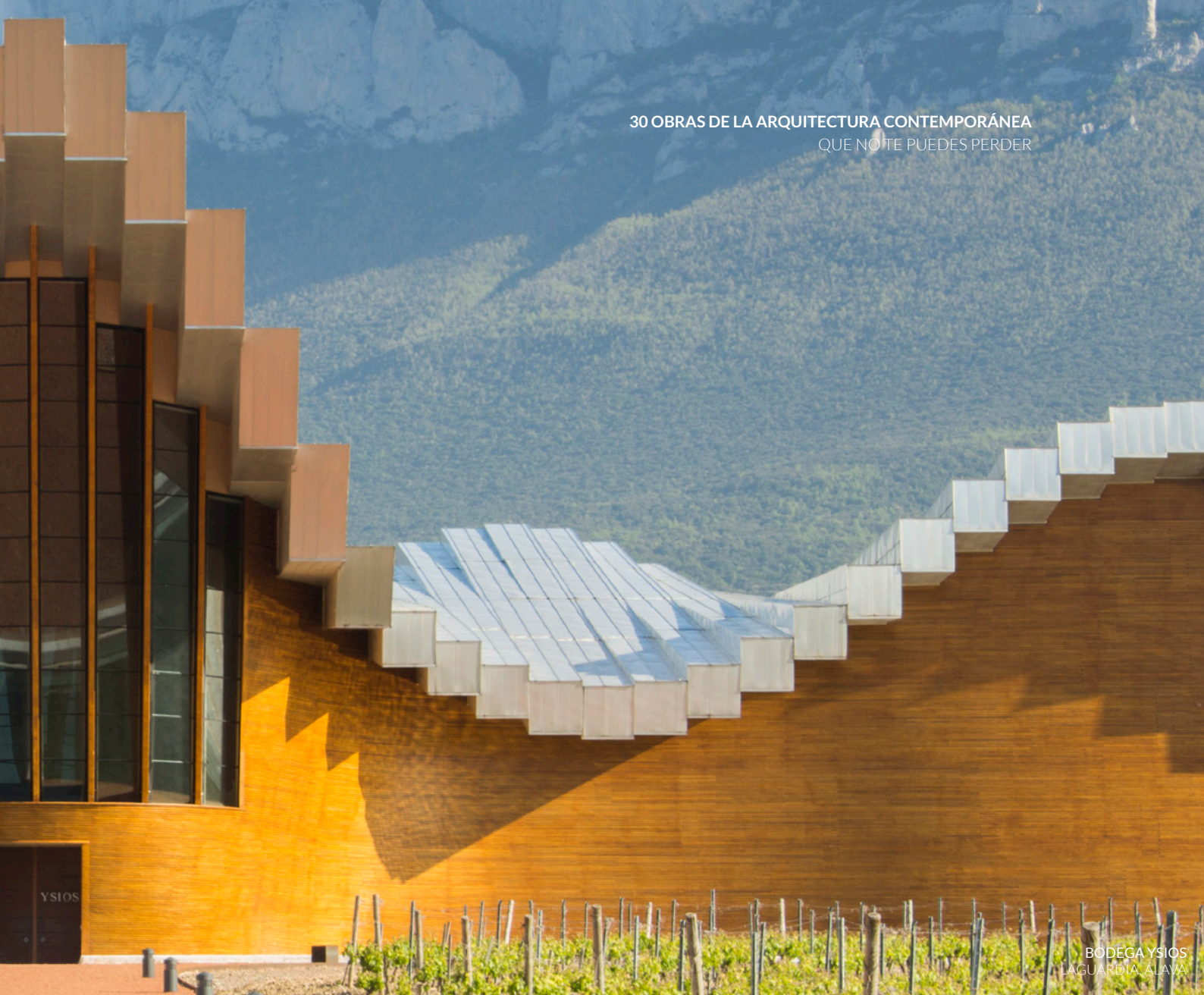
BODEGA YSIOS LAGUARDIA, ALAVA

La propuesta es una reinterpretación contemporánea de las construcciones tradicionales relacionadas con el vino. La base del edificio tiene bodegas excavadas en el terreno , conectadas con las que se encuentran desde tiempo inmemorial bajo la ladera del cerro sobre el que descansa el castillo de Peñafiel.