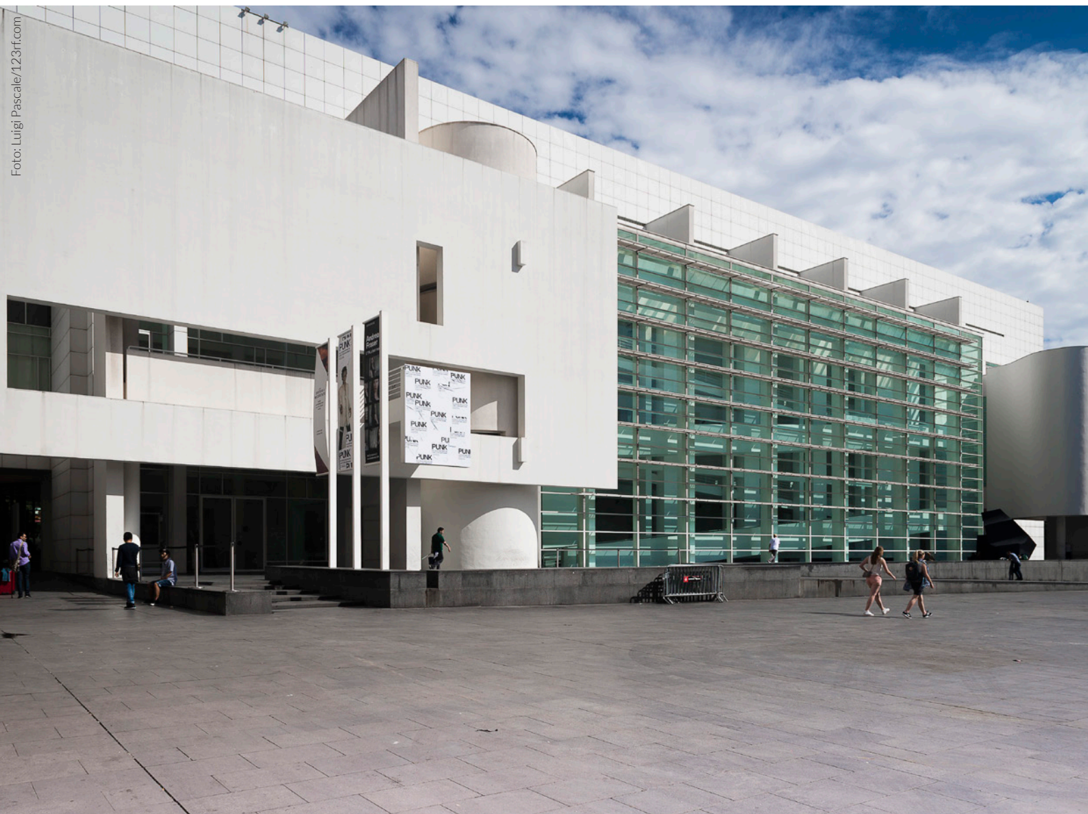
▲ MACBA BARCELONA