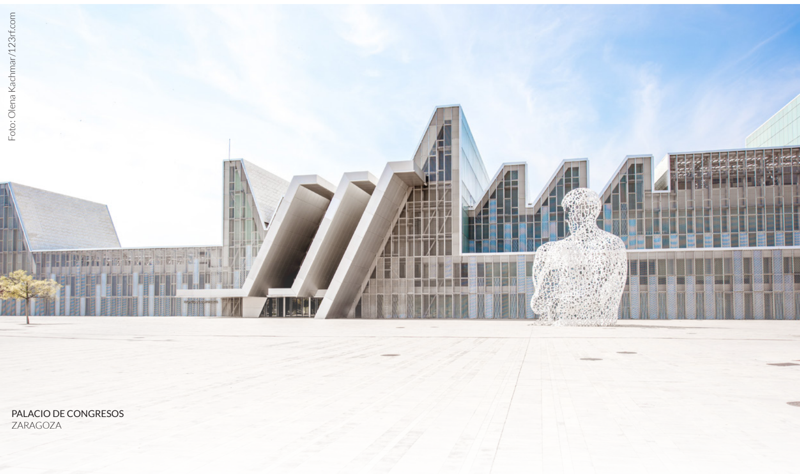
PALACIO DE CONGRESOS ZARAGOZA