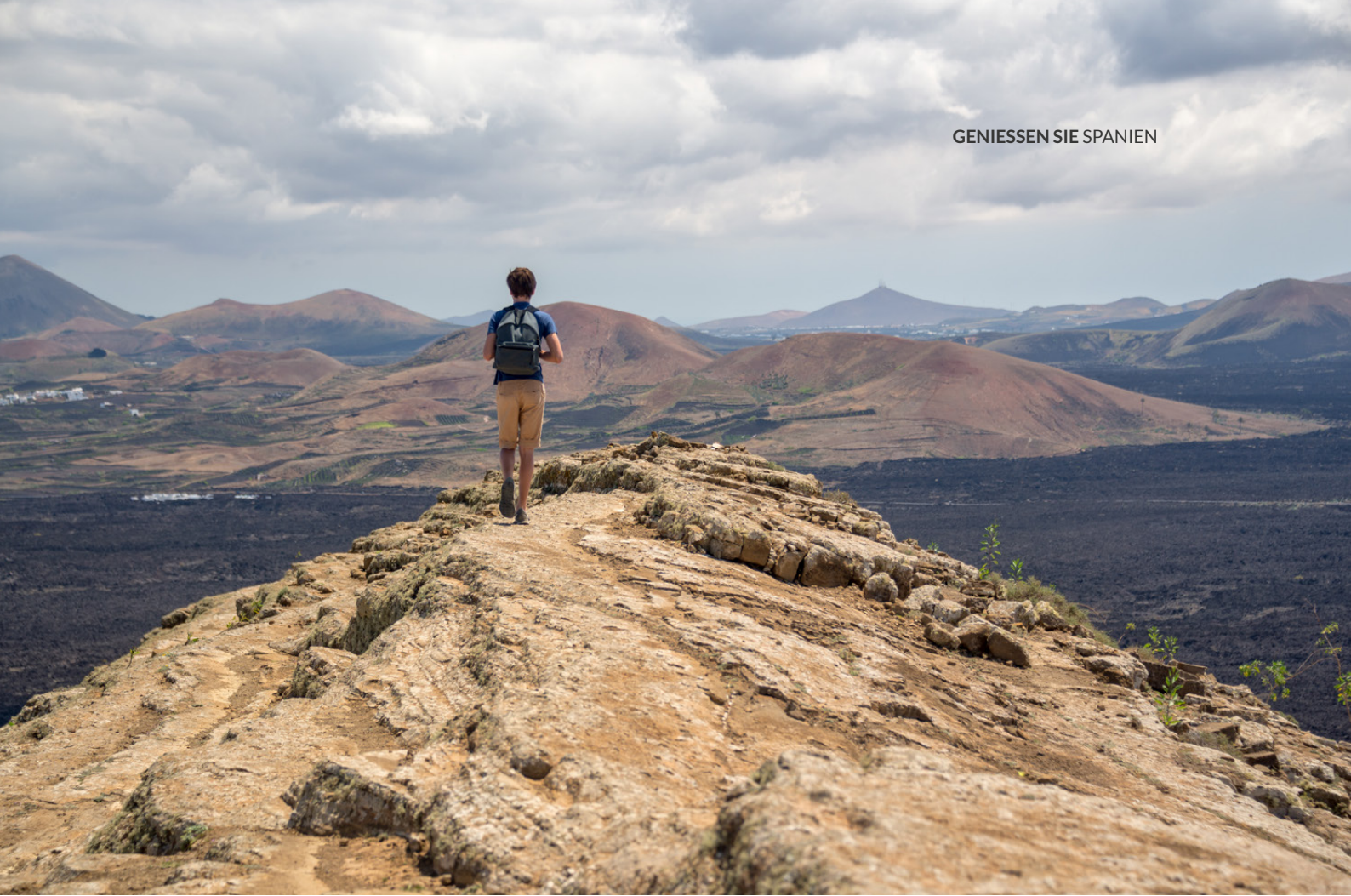
▲ NATIONALPARK TIMANFAYA LANZAROTE