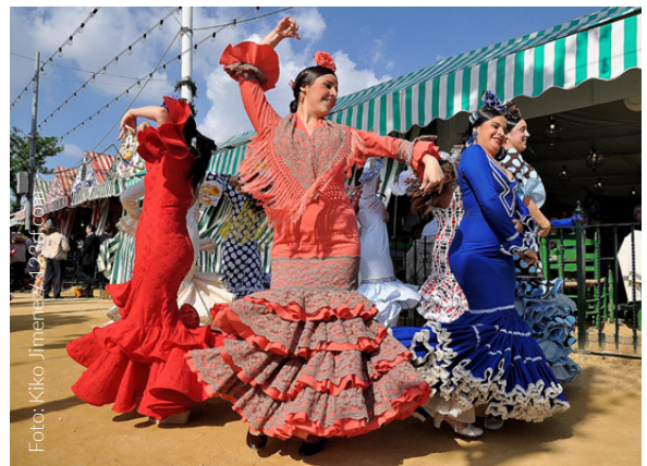
▲ FRÜHLINGSFEST FERIA DE ABRIL SEVILLA

Sevilla während des Frühlingsfestes ist gleichbedeutend mit Spaß zu jeder Tageszeit. Das Jahrmarktgelände und die Stände sind erfüllt von Musik, Gelächter, Speisen und Gläsern mit Fino-Sherry oder „rebuji-to“ (Manzanilla-Wein mit klarer Limonade). Fahren Sie nicht ab, ohne den „pescaíto frito“ (frittierten Fisch) probiert zu haben, und genießen Sie die eindrucksvolle Parade der Reiter und Pferdekutschen.