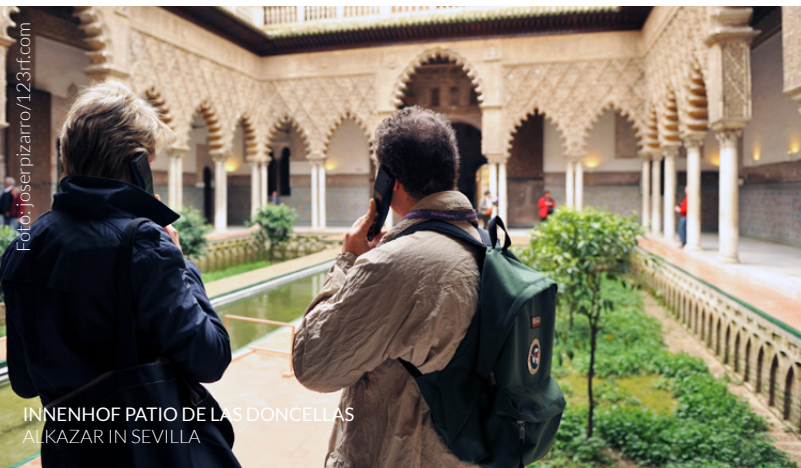
INNENHOF PATIO DE LAS DONCELLAS ALKAZAR IN SEVILLA

Reisen Sie in die Vergangenheit und fahren Sie dabei durch ruhige Landschaften, probieren gastronomische Köstlichkeiten und lernen Sie die Volksfeste und Bräuche der Orte kennen, durch die Sie kommen. Bewältigen Sie einige Abschnitte mit dem Pferd, dem Fahrrad oder zu Fuß.