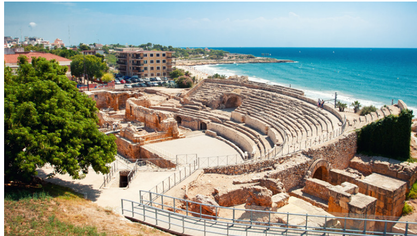
▲ RÖMISCHES AMPHITHEATER TARRAGONA

Die Römische Route Hispania Baetica führt durch 14 andalusische Orte der Pro-