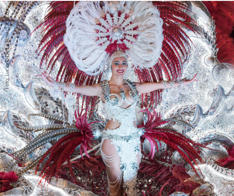
▲ KARNEVAL AUF TENERIFFA

In Spanien finden das ganze Jahr über Volksfeste statt. Erleben, spüren und genießen Sie Spanien auf seinen Volksfesten.