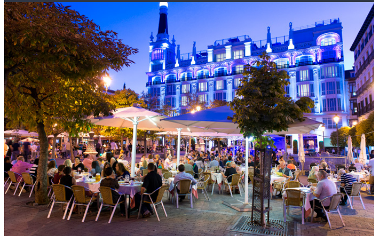
▲ PLAZA DE SANTA ANA MADRID