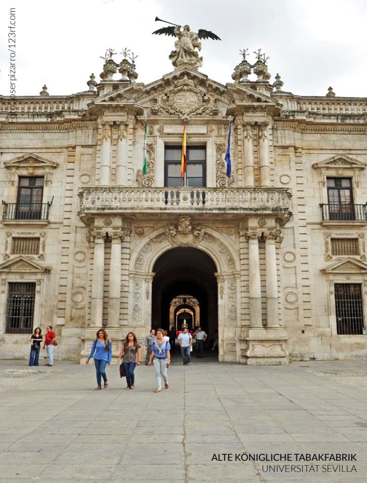
ALTE KÖNIGLICHE TABAKFABRIK UNIVERSITÄT SEVILLA