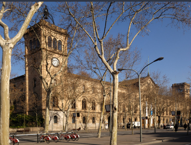
▲ UNIVERSITÄT BARCELONA

Ihre geographische Lage und ihr Kultur- und Freizeitangebot machen diese kosmopolitische und offene Stadt zu einem idealen Ziel für alle, die einen unvergesslichen Aufenthalt erleben möchten. In Barcelona befinden sich einige der wichtigsten Universitäten Spaniens wie Pompeu Fabra, die Universität Barcelona und die Universität Autònoma von Barcelona.