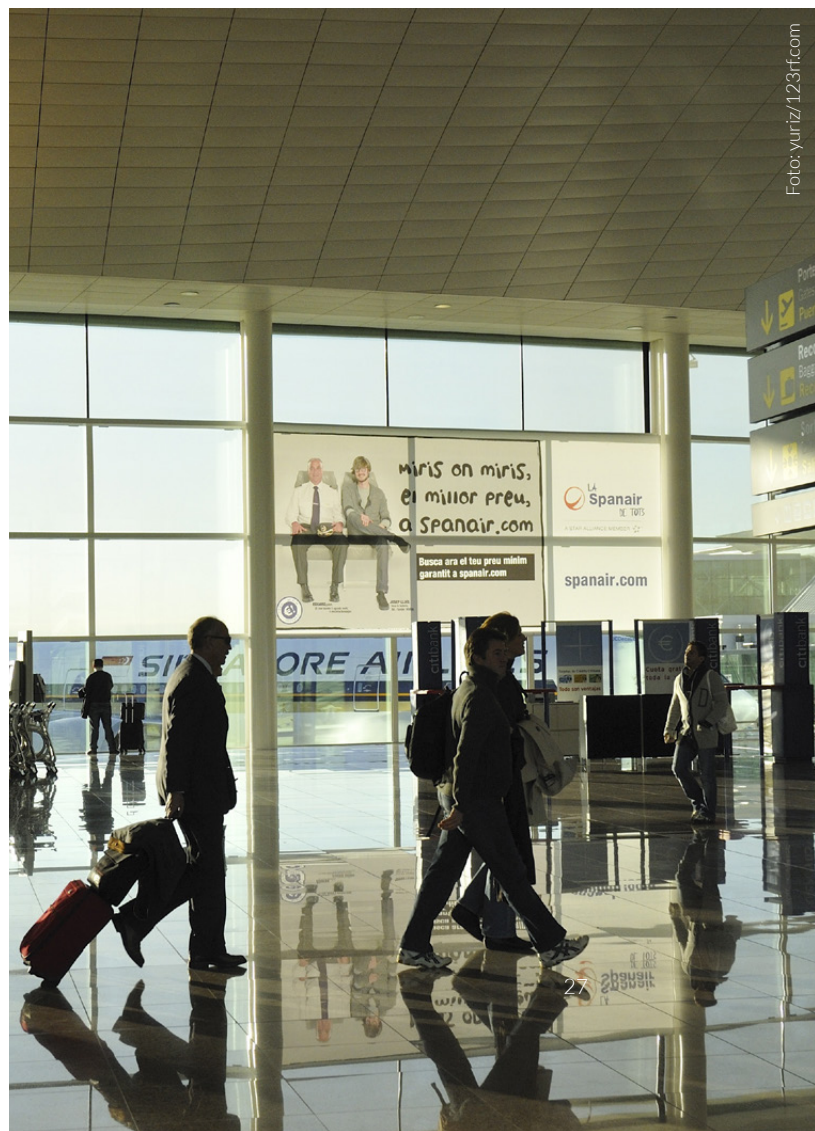
▼ FLUGHAFEN BARCELONA-EL PRAT