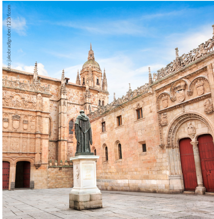
▲ UNIVERSITÄT SALAMANCA

Die Universität Salamanca , die älteste in Spanien, hat die längste Tradition und genießt das größte Ansehen im Unterrichten von Spanisch.