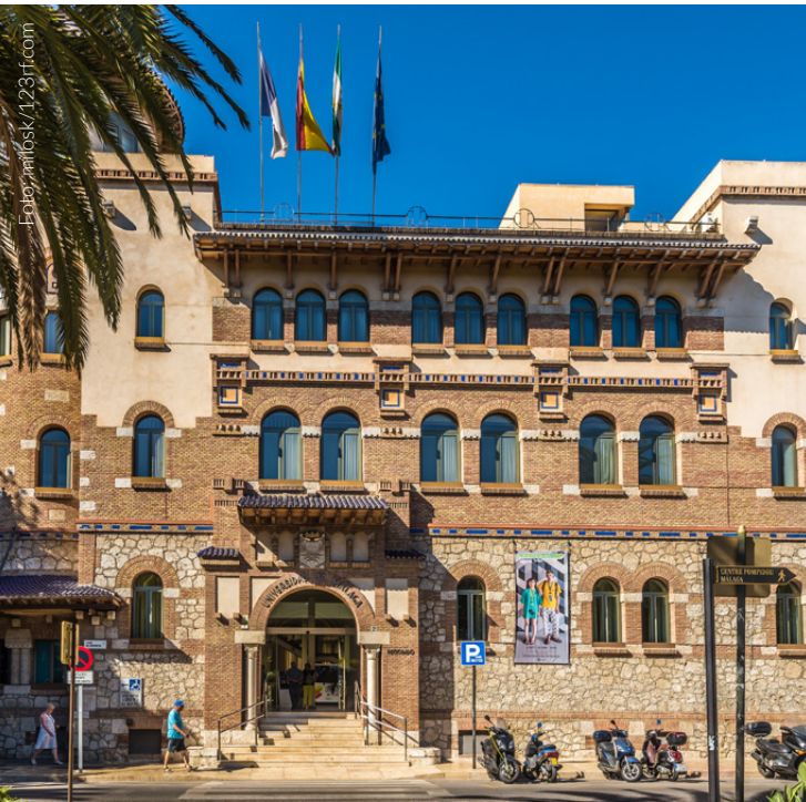
▲ UNIVERSITÄT MÁLAGA