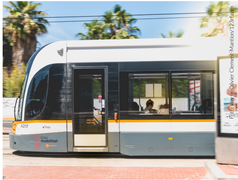
▲ STRASSENBAHN VALENCIA

➤ Weitere Informationen finden Sie auf www.studyinspain.info und www.uniquespain.travel