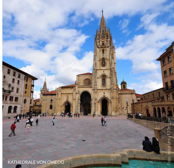
KATHEDRALE VON OVIEDO

Wenn Sie die Compostela erhalten möchten, das Dokument, das jedem überreicht wird, der den Weg aus religiösen oder spirituellen Gründen gemacht hat, müssen Sie mindestens 100 Kilometer zu Fuß oder mit dem Pferd bzw. 200 Kilometer mit dem Fahrrad zurückgelegt haben.