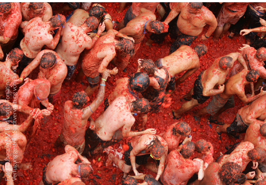
▼ TOMATENSCHLACHT LA TOMATINA BUÑOL

Dieses lustige Fest, bei dem jeder jeden mit Tomaten bewirft, findet in Buñol (Valencia) statt. Auf geht's, werfen Sie sich in das Schlachtgetümmel.