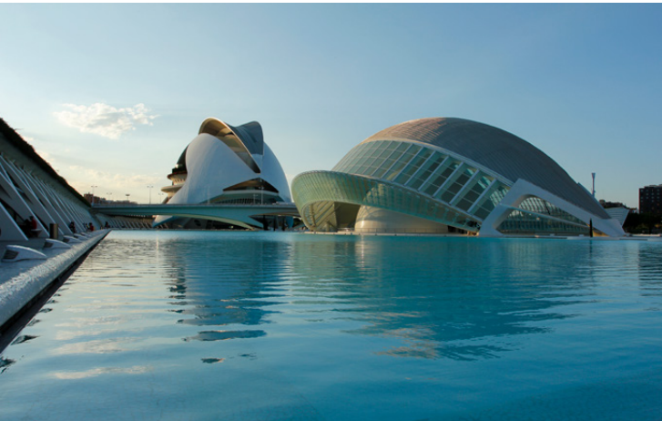
▲ STADT DER KÜNSTE UND WISSENSCHAFTEN VALENCIA

Valencia , eine Stadt voller Kontraste, ist die Essenz des Mittelmeeres. Erkunden Sie ihre Altstadt und lassen Sie sich von ihren avantgardistischen Gebäuden begeistern. Besuchen Sie die Stadt der Künste und Wissenschaften , eines der größten Wissenschafts- und Kulturzentren Europas, das bisher jeden in Staunen versetzt hat.