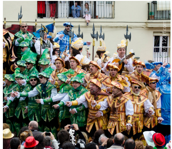
▲ KARNEVAL IN CÁDIZ

Während der Fallas widmet sich ganz Valencia dem Feiern und der Musik. Eine Woche lang füllt sich die Stadt mit den sogenannten „Ninots“ (riesige Figuren, mit denen auf humorvolle Weise Sozialkritik geübt wird), die zum Schluss in spektakulären Feuern verbrannt werden.