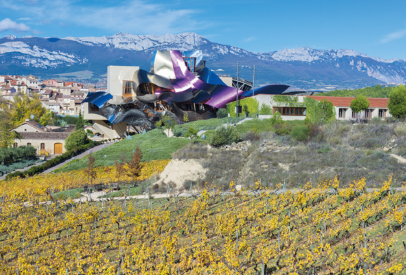
▲ MIASTO WINA (CIUDAD DEL VINO) ELCIEGO