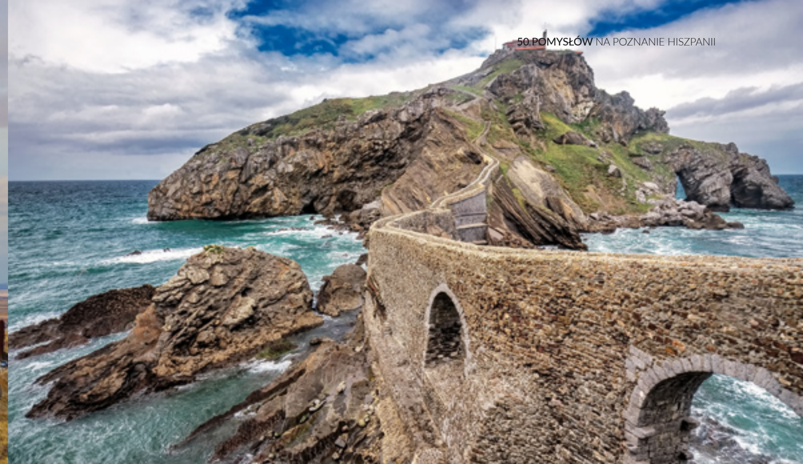
▲ KLASZTOR SAN JUAN DE GAZTELUGATXE BERMEO, KRAJ BASKÓW

W Ossa de Montiel (w prowincji Albacete) możesz przywołać książkowe epizody i osobiście doświadczyć dwóch z nich: wejść do jaskini Montesinos i zobaczyć zamek Rochafriada.