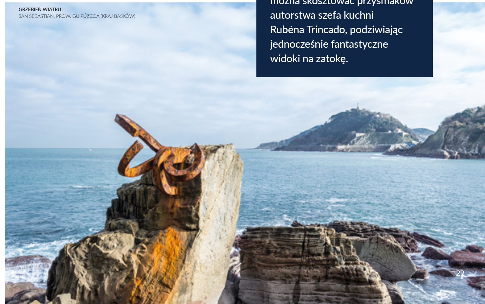
GRZEBIEŃ WIATRU SAN SEBASTIAN, PROW. GUIPÚZCOA (KRAJ BASKÓW)

W Kraju Basków czeka na ciebie Szlak Rioja Alavesa . Można tu podziwiać nowoczesne świątynie wina w postaci awangardowych budynków i piwnic winiarskich, dzieła najśłynniejszych współczesnych architektów, takich jak Santiago Calatrava, autor projektu winiarni Ysios w Laguardii lub Frank Gehry, twórca Miasta Wina (Ciudad del Vino) w Elciego. Wokół tych enklaw czekają liczne oferty spa i relaksu, by w pełni skorzystać z dobrodziejstw regionu.