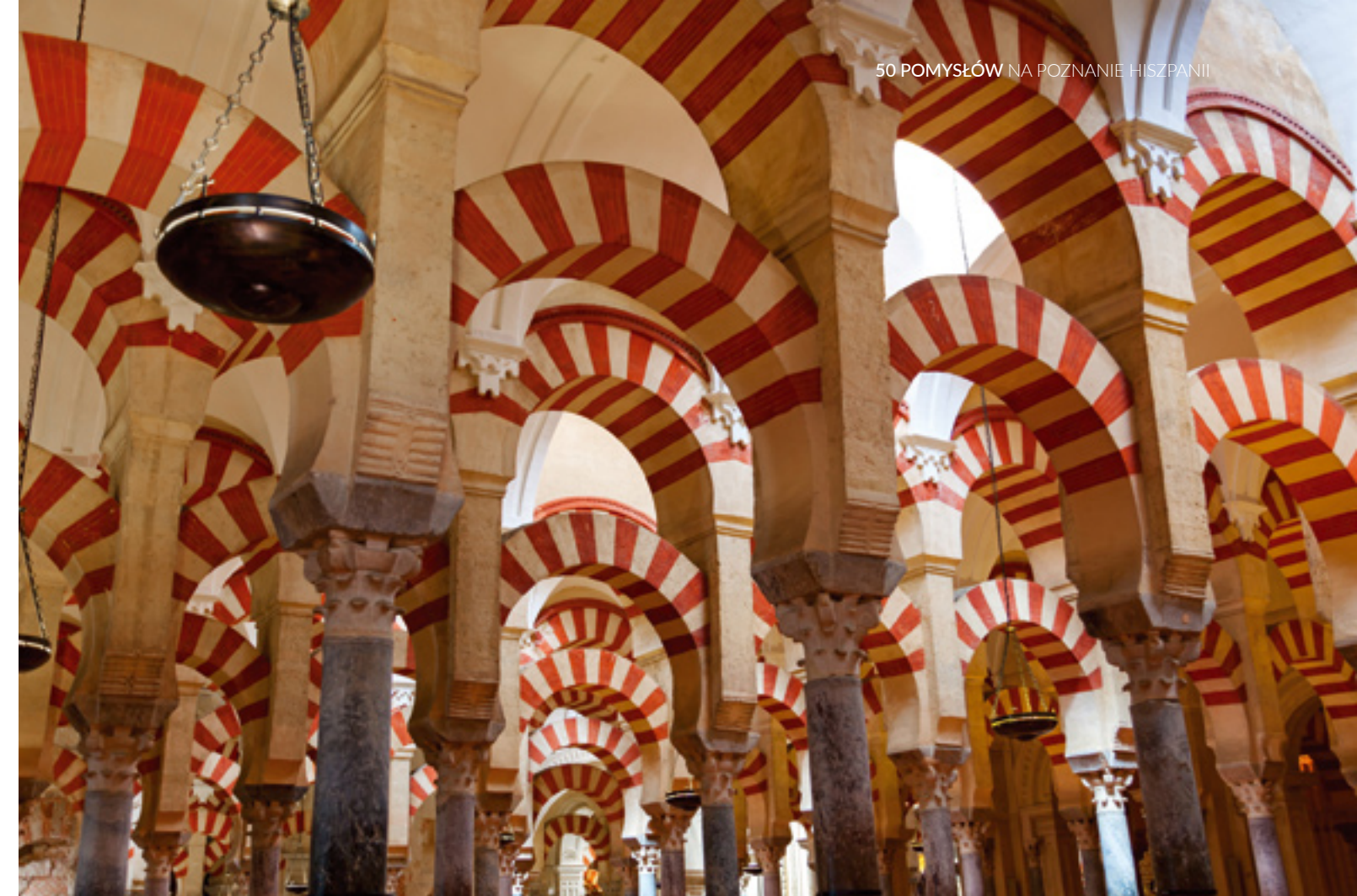
▲ DAWNY MECZET W KORDOBIE