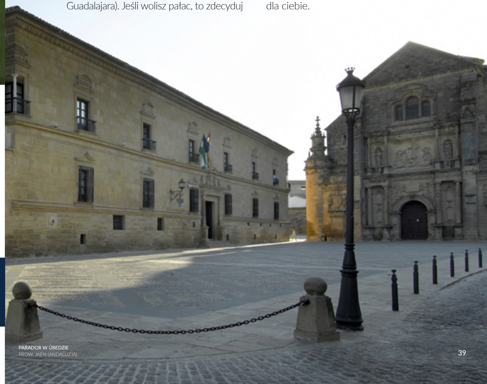
PARADOR W ÚBEDZIE PROW. JAÉN (ANDALUZJA)

Obecnie w Hiszpanii funkcjonuje ponad 90 Paradorów Turystycznych. Jest w czym wybierać. Zazwyczaj zlokalizowane są w wyjątkowych miejscach, pośród przyrody, w świetnych punktach widokowych lub w historycznych centrach miast. Wiele z nich to hotele zabytkowe, więc jeśli lubisz dawne dzieje, to jest to wybór dla Ciebie.