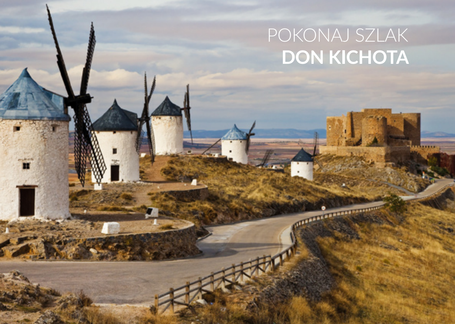
▲ WIATRAKI CONSUEGRA (KASTYLIA-LA MANCHA)

Zanurz się w klasycznej literaturze ogólnoswiatowej – czyli świecie Don Kichota z La Manchy . Na jego szlaku zobaczysz wielowiekowe miasteczka, trakty historyczne i krajobrazy opisane przez Miguela Cervantesa.